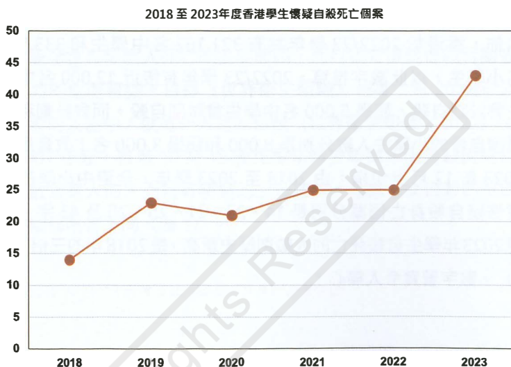
圖 2. 2018 至 2023 年度香港學生懷疑自殺死亡個案

資料來源：2018 至 2022 年數據來自香港教育局，2023 年數據來自香港撒瑪利亞防止自殺會 2023 年年報